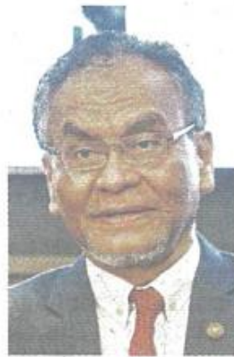
Datuk Seri Dr Dzulkefly Ahmad

“The ministry’s services, including emergency services via MERS999, are always available for those in need,” Dr